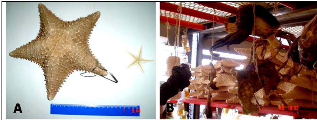
Fig. 3 Estrelas-do-mar secas à venda em mercados populares do nordeste do Brasil: a) Oreaster reticulatus (esquerda) e Astropecten sp. (direita), e b) Aglomerado de estrelas ( Oreaster reticulatus ) junto a couro de lagartos.